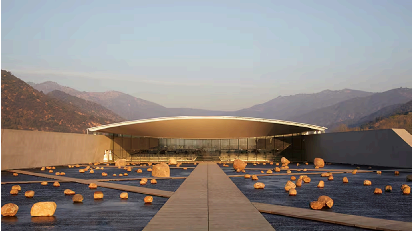
Pritzker de doble filo