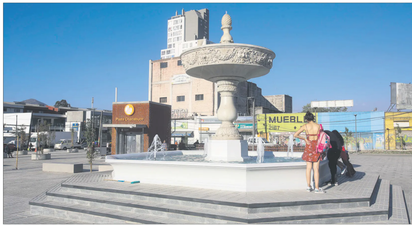
Sectores con escasa vegetación, como Plaza Chacabuco en Independencia, son de los más calurosos de Santiago.

Autopistas, calles y zonas industriales sin áreas verdes explican en parte el sofoco que padecen los residentes de muchos barrios.